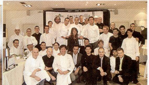
Cocineros, organizadores y autoridades.